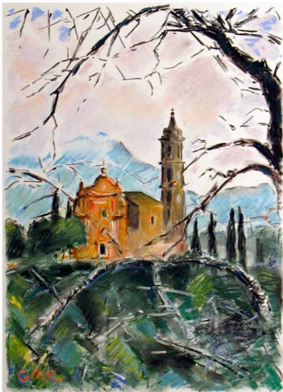
Pastel de BM COLLET

Réduction de - 5% pour toute inscription à plus de 70 jours du départ.