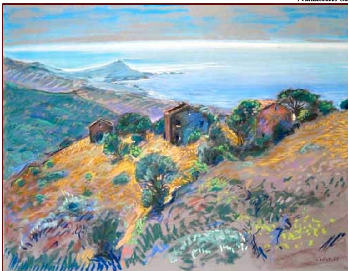
Pastel de BM COLLET