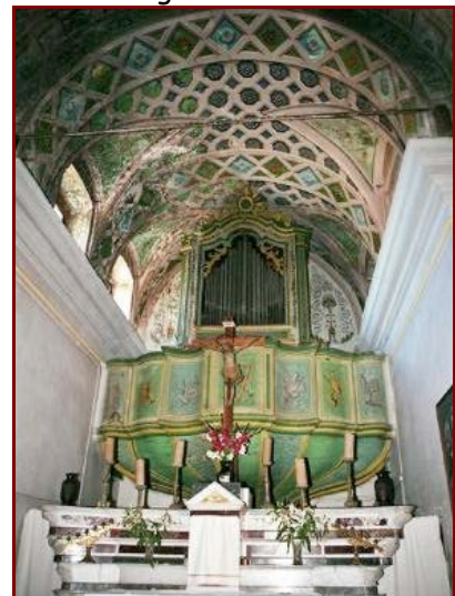
Orgue de Feliceto (Balagne)