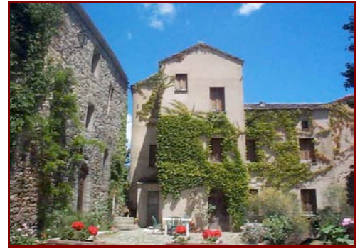
Les gîtes de Tevola

Le soir dégustation de produits locaux de Castagniccia. Durant l'apéritif, la présentation par leurs auteurs du livre « la cuisine Corse de ma grand-mère » de JC et D. Rogliano , permettra de plonger dans les traditions culinaires locales, rythmés par les fêtes et les saisons de la vie des villageois, évoquée ici par des extraits de textes corses. Dans notre fond de livres, nous mettrons également en avant les auteurs évoquant les traditions rurales et pastorales corses.