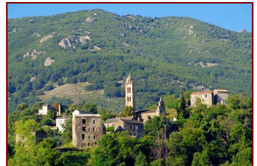
Dans la Castagniccia

En soirée, propositions d'auteurs bastiais/cap Corsins de notre fonds de livres corses.