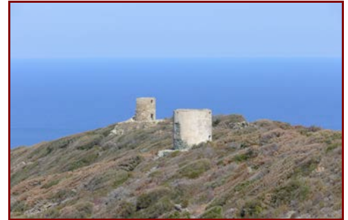
Le cap corse

Le soir, dernier dîner aux gîtes. Cette soirée se déroulera dans une ambiance musicale où vous pourrez écouter divers artistes et prendre connaissance de leurs textes traduits du corse, d'une grande qualité poétique. Un groupe local de paghjella complètera peut-être notre immersion dans la musique Corse authentique. (sous réserve de confirmation).