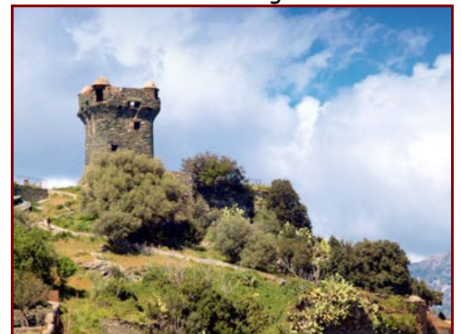
La tour de Nonza